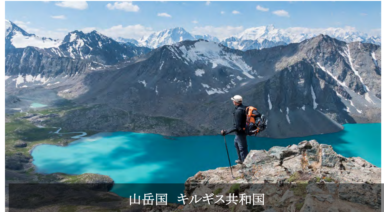
山岳国 キルギス共和国