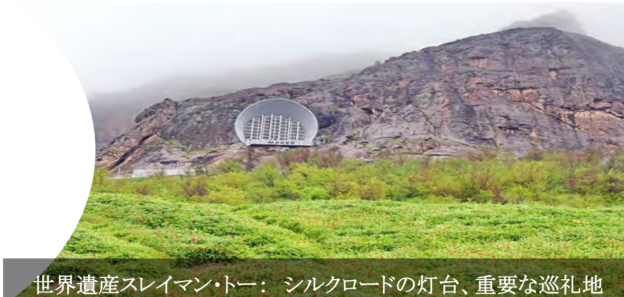
世界遺産スレイマン・トー：シルクロードの灯台、重要な巡礼地