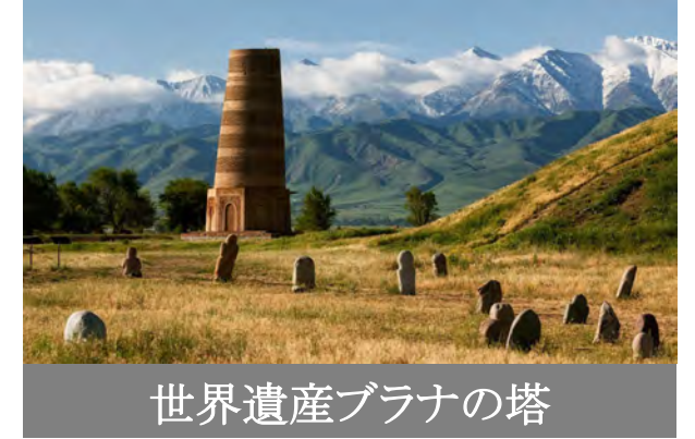
世界遺産ブラナの塔